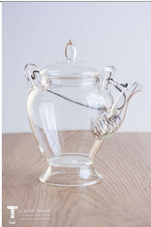
Théière 45 cl : 29€05