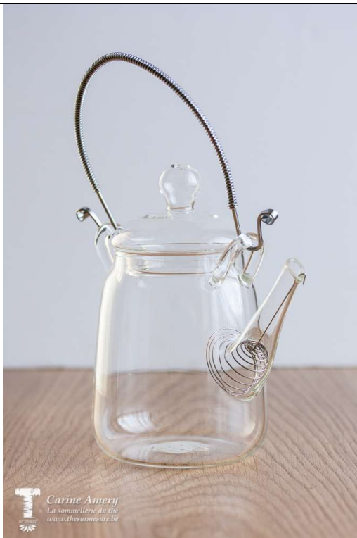
Théière 30 cl : 20€80