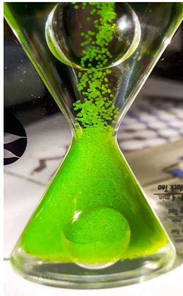
Sablier 'à remonter le temps' : 18€

T sur Mesure - Carine Amery – 50, rue du Moulin au Bois – 7022 Hyon – Belgique T. +32 (0)65 97 34 56 – M. +32 (0)475 86 17 33 – www.thesurmesure.be - info@thesurmesure.be Facturation via Production Associées/16762ANN – Av Emile Féron, 70 1060 Bruxelles BE0896.755.397