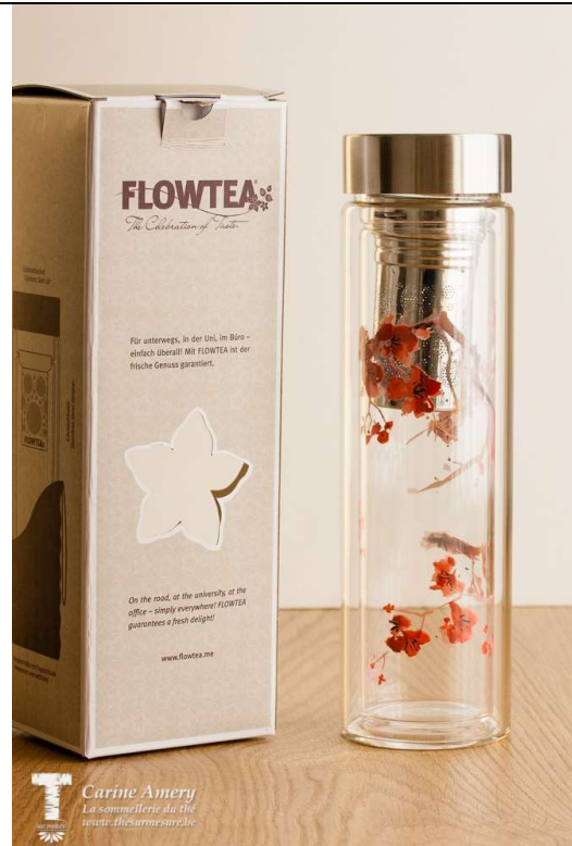
Théière nomade Flow Tea (4 motifs différents) : 30€