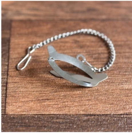
Tea-click : fermoir pour filtres de papier : 2€50