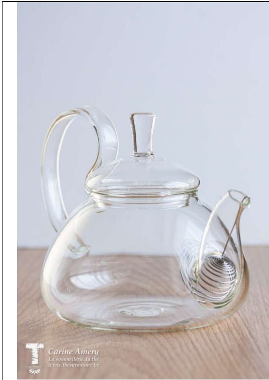
Théière 800 ml : 32€50