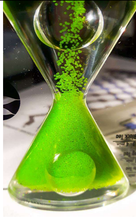
Sablier 'à remonter le temps' : 18€

Boîtes à thé à double couvercle, pour une conservation optimale de vos feuilles de thé : nombreux motifs, recouvertes de papier washi ou d'un film inaltérable