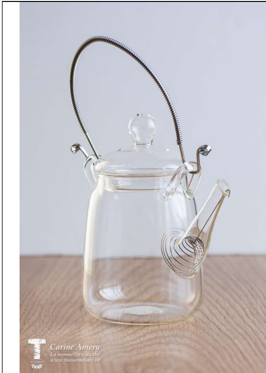
Théière 30 cl : 20€80