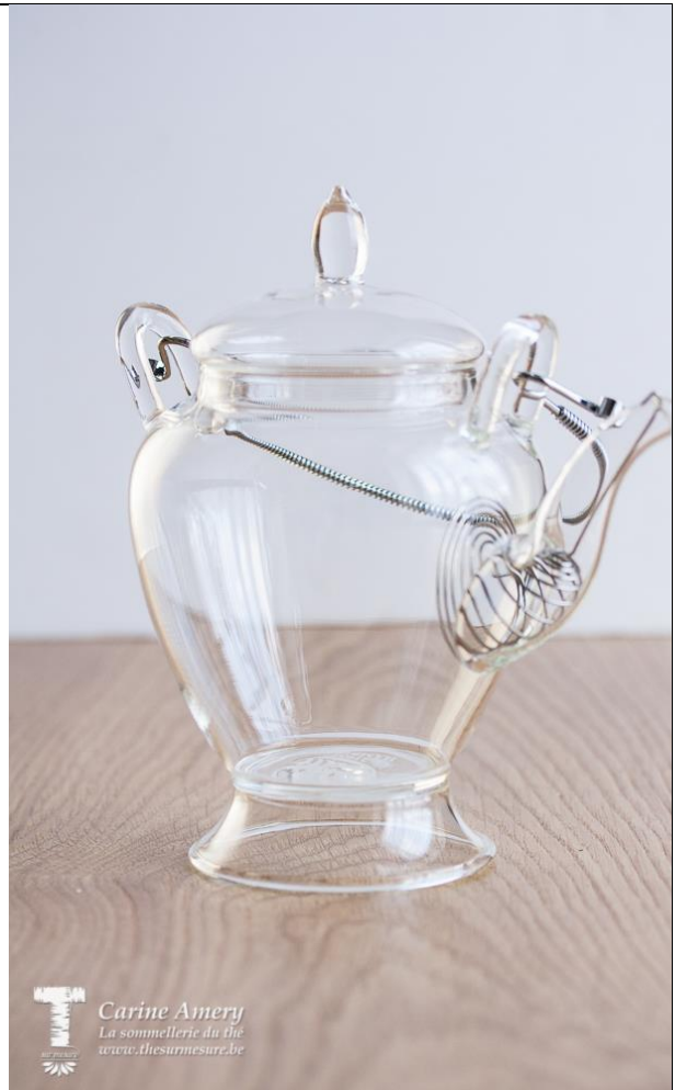
Théière 45 cl : 29€05