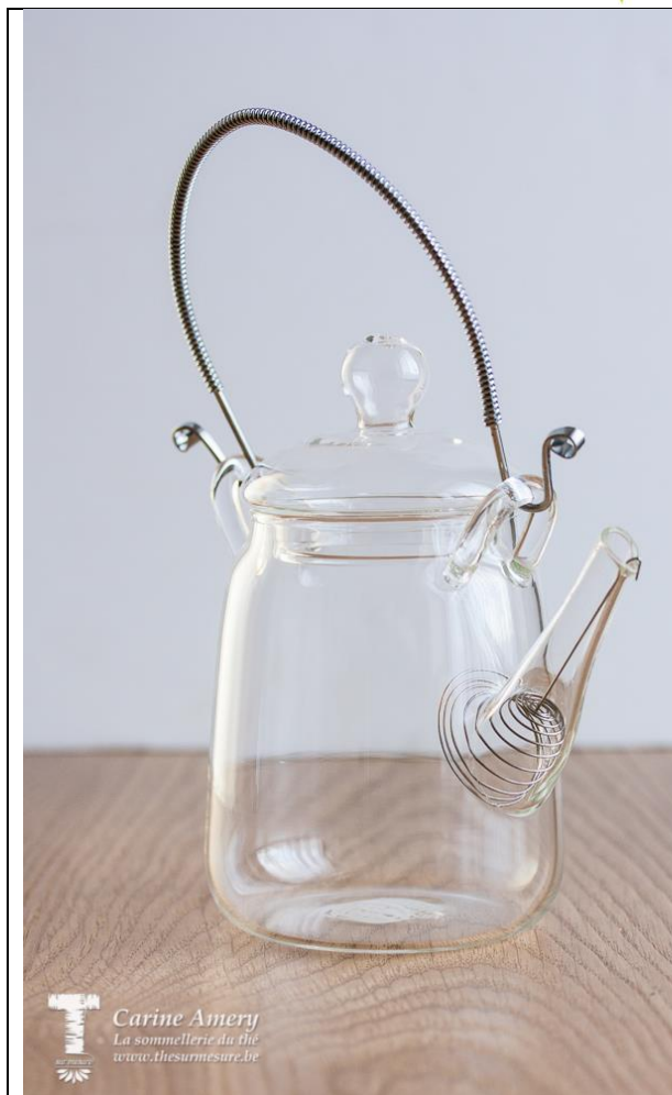
Théière 30 cl : 20€80