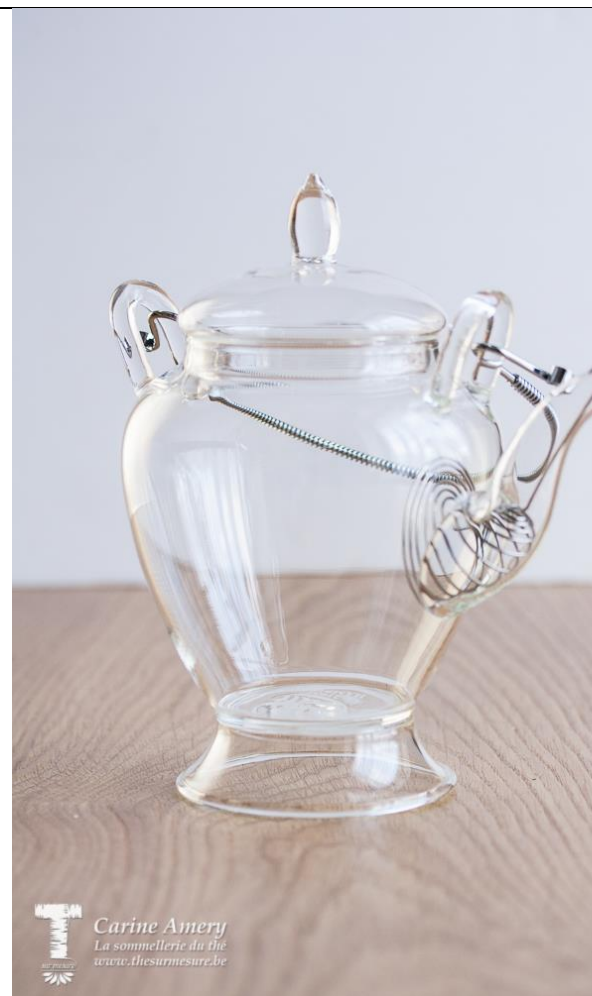
Théière 45 cl : 29€05