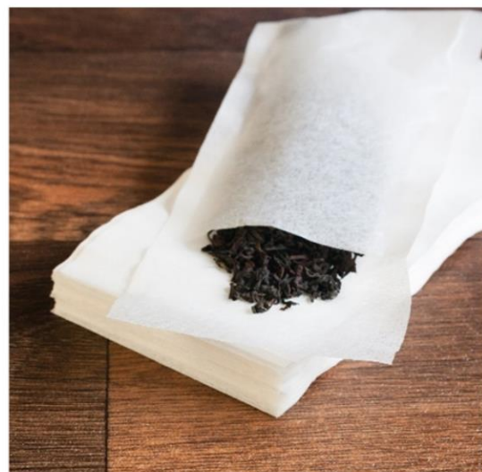
100 filtres papier blanc Taille S : 5€10 – Taille M : 5€60